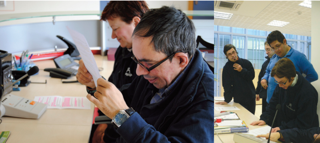
► Sondika y Zalla son dos de los talleres que se han animado a montar una radio

Sondika, Sestao, Zalla y Etxebarri son talleres que han puesto en marcha sus propias emisoras de radio. Con el objetivo de generar comunicación entre las personas del taller, informan de las novedades del centro y diariamente emiten un boletín informativo.