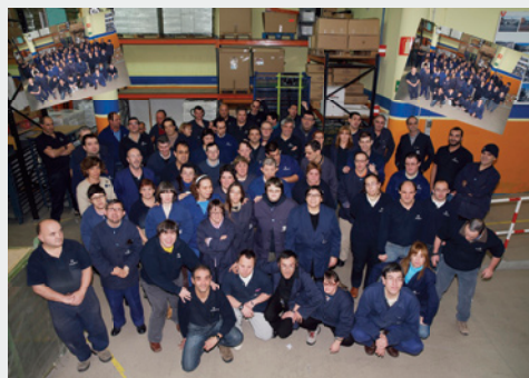
► El equipo del taller de Otxarkoaga celebró el 25 aniversario de éste el pasado 12 de marzo

Gaur egun tailer horretan 77 lagunek egiten dute lan eta horietatik 73k urritasunen bat dute. Muntaketa elektrikoak egiten dituzte.