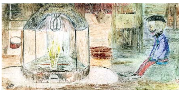
Ésta fue la postal ganadora de 2006