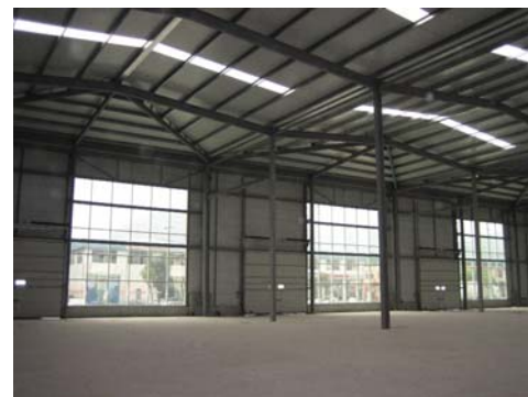
Imagen del nuevo pabellón en Abadiño