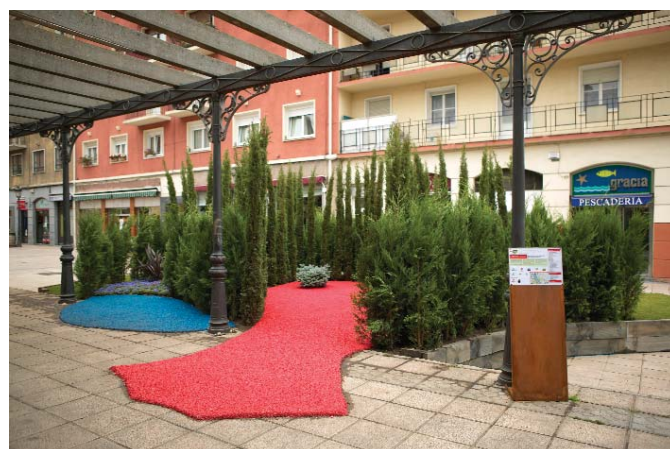
El jardín Shine on, You secret diamond estará instalado en la plaza Levante de San Inazio hasta el próximo 5 de agosto

Lantegi Batuak ere ekitaldiaren partaide izango da, aurkeztutako 20 lanetarik bati bere babesa eskainiz; Shine On You Secret Diamond deritzon