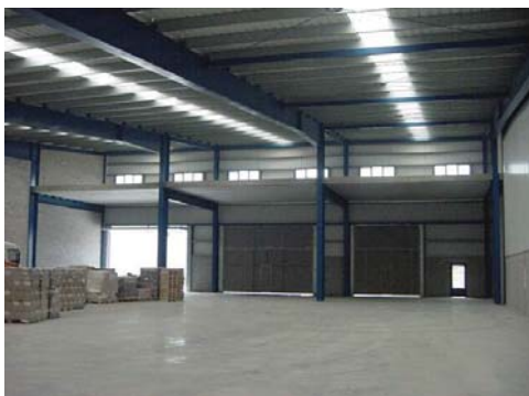
Interior del nuevo pabellón en Etxebarri

Programa horretan parte hartzen duen 12 pertsonako taldeak 100 orduko prestakuntza teorikoa egin du. Iragan den ekainaren 23an hasi zuten prestakuntza praktikoa hainbat tailerretan monitore eta laguntza-teknikari legez. Praktika horietan muntaia elektriko eta elektronikoak, mekanizatuak eta muntaiak, bestelako muntaiak, publizitate zuzena eta antzeko jarduerak egiten dituzte.