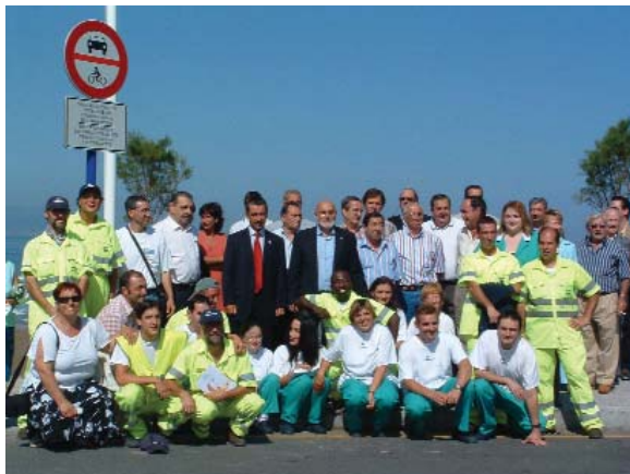
Los trabajadores del vial de Sopelana asistieron el año pasado a la entrega de la bandera azul a la playa de la localidad